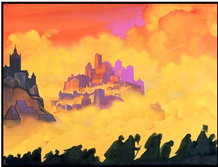
N. ROERICH – ARMAGEDDON

Il Pensatore incoraggiava saggiamente i discepoli predicando la vittoria delle Forze luminose “. (Sovramundano II, 259)