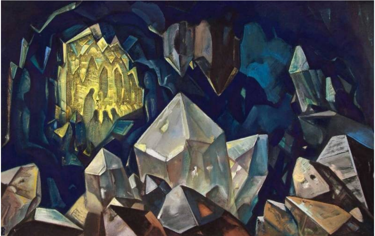
N. ROERICH - IL TESORO DELLA MONTAGNA

Il re del Mondo in oriente è noto come Rigden-jyepo mentre in occidente col nome di Melchisedech. N. Roerich nel 1933 dipinge in Tesoro della Montagna una caverna luminosa ricoperta di cristalli una figura con un calice in mano, il Cristo, l'Agnello dell'Apocalisse, e attorno ad un tavolo come dei cavalieri del Graal, i Maestri di Luce e Saggezza del cerchio più interno, devono essere 12 in numero.