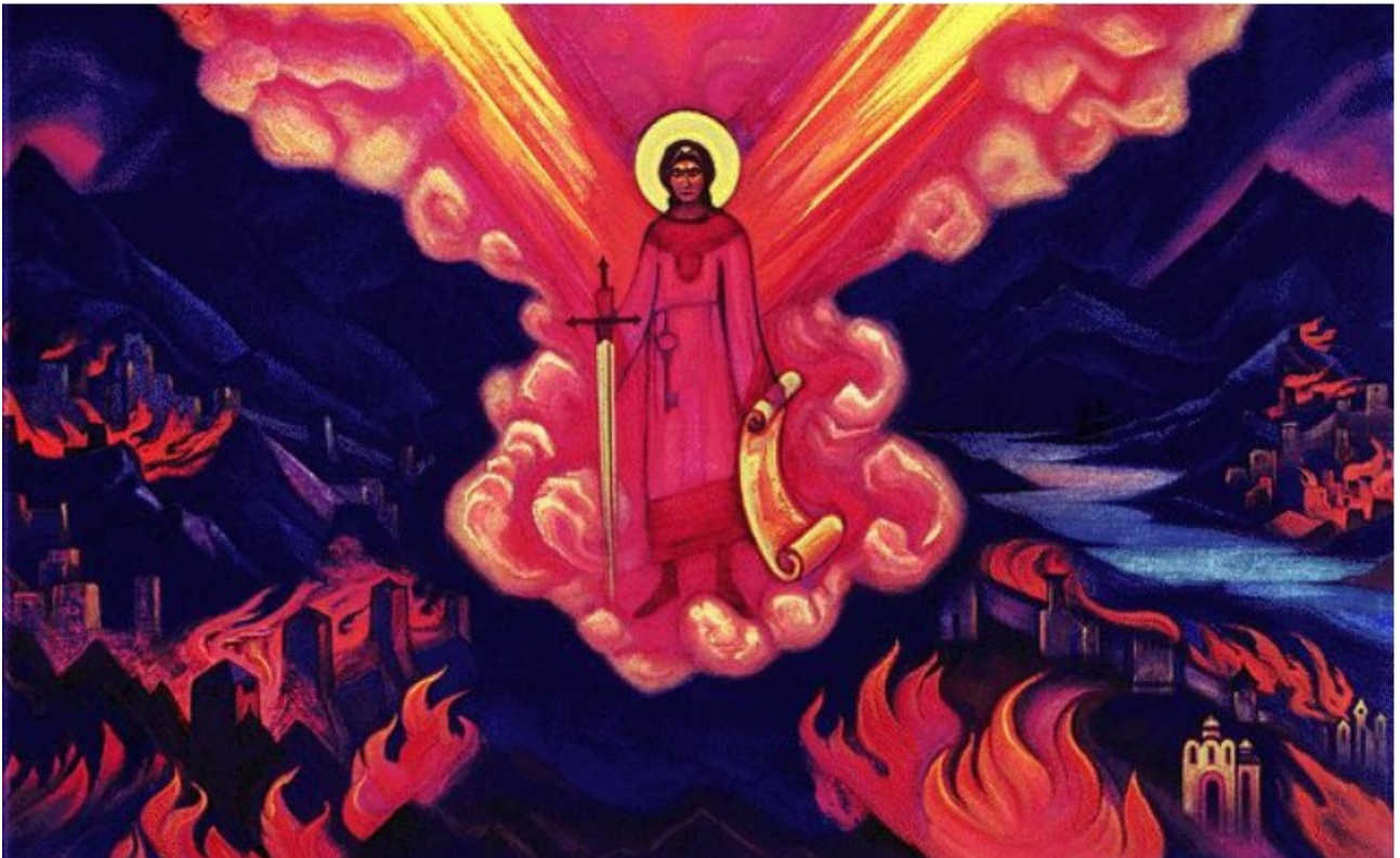
N. ROERICH L'ULTIMO ANGELO

Poi vidi un altro Angelo potente che scendeva dal cielo, avvolto in una nuvola; sopra il suo capo era l'arcobaleno; la sua faccia era venire il sole, e i suoi piedi venire colonne di fuoco; In mano teneva un libretto aperto. ... Sette tuoni emisero le loro voci ... [e] io stavo per scrivere ... [ma] sentii una voce dal cielo dire dentro di me: Sigilla le cose che i sette tuoni hanno detto, e non le scrivere (Ap. X, 1-4).