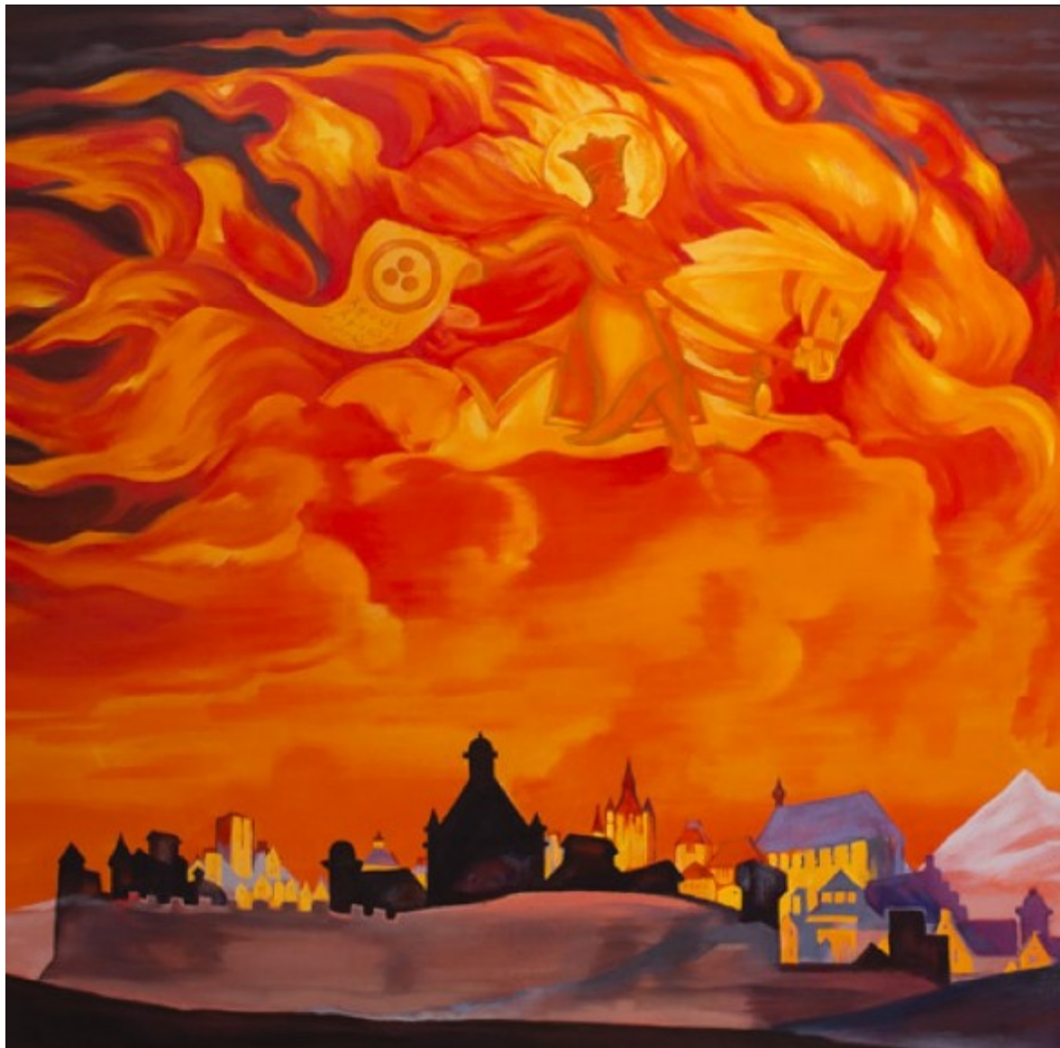
N. ROERICH SANTA SOPHIA LA SAGGEZZA ONNIPOTENTE

dell'altro , ma che prima d'ogni altra cosa hanno avuto le nazioni una dell'altra, anche se non ne erano consapevoli. Per scoprire la fonte del male è sufficiente seguire le fonti di paura economica, sociale, sanitaria, con attenzione per scoprire chi sta manipolando l'umanità.